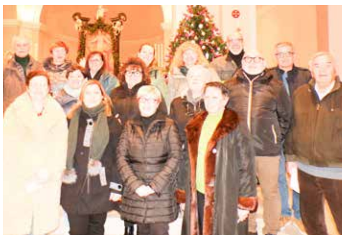
La corale della parrocchia di San Carlo

La scelta dei canti viene effettuata tenendo in conside-