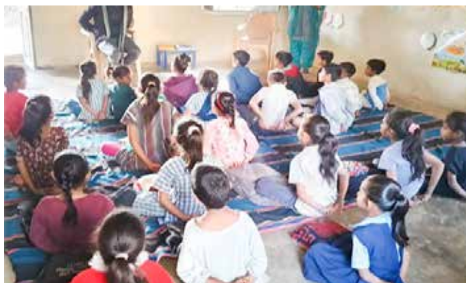
L'attività educativa nella missione di Chhota Udepur

Dall'inizio di quest'anno ben 798 bambini stanno prenden-