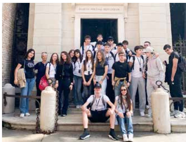
Le seconde del liceo scientifico a Ravenna