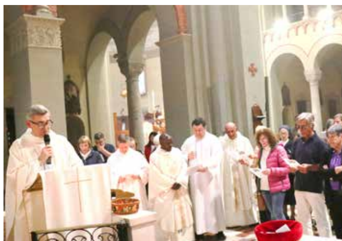
La recita della supplica alla Madonna di Pompei