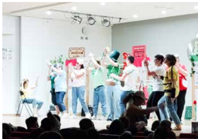
Lo spettacolo all'Auditorium Ghezzi di Carate B.

Quella degli Special Games è stata un'esperienza indimenticabile, vissuta accanto a persone straordinarie che ogni giorno sfidano i propri limiti con coraggio, passione e determinazione.