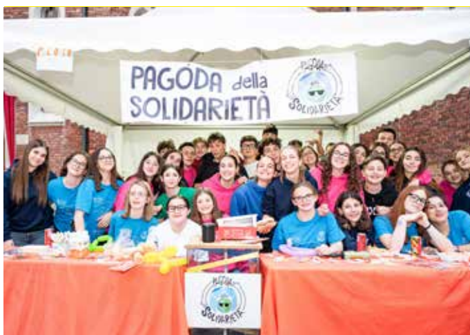
Ragazze/i impegnati nella Pagoda della solidarietà