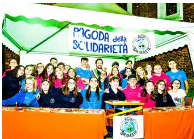
Un gruppo di volontari della Pagoda con il sindaco