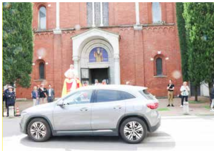
La benedizione delle auto per S. Francesca Romana