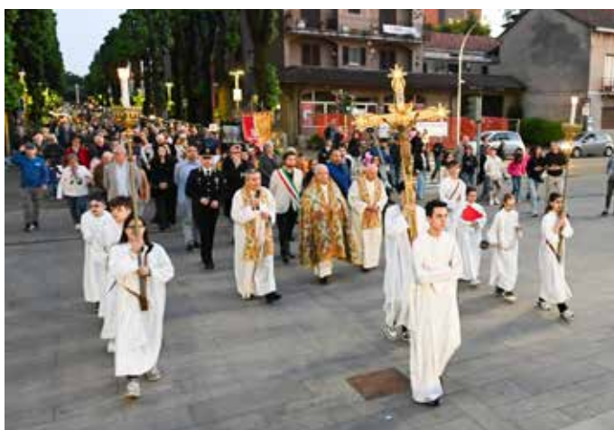
La processione che ha aperto le celebrazioni

Davvero tutto secondo le attese e le tante dita incrociate dei giorni precedenti. Non è difficile immaginare la gioia