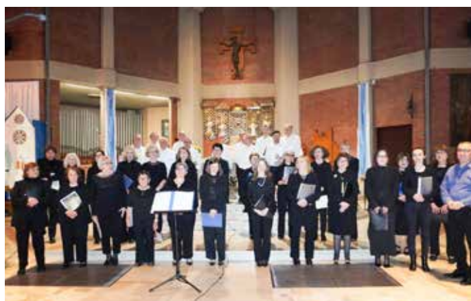
Il coro don Luigi Fari, la cappella Santa Cecilia e il duo MiRo nel concerto "Ode a Maria"