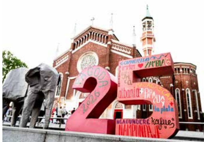
Il 'logo' dei 25 anni della Pagoda della solidarietà