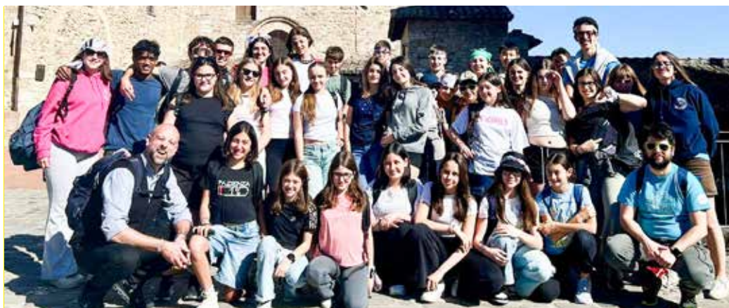
Il gruppo di preadolescenti che hanno partecipato al pellegrinaggio ad Assisi