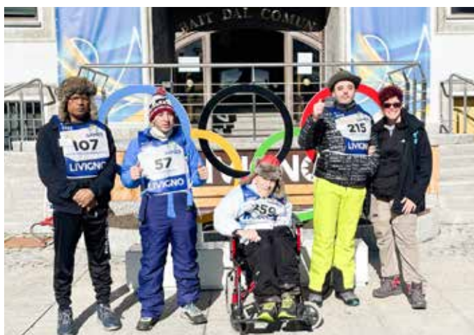
I ragazzi in gara alla Livigno Special Games