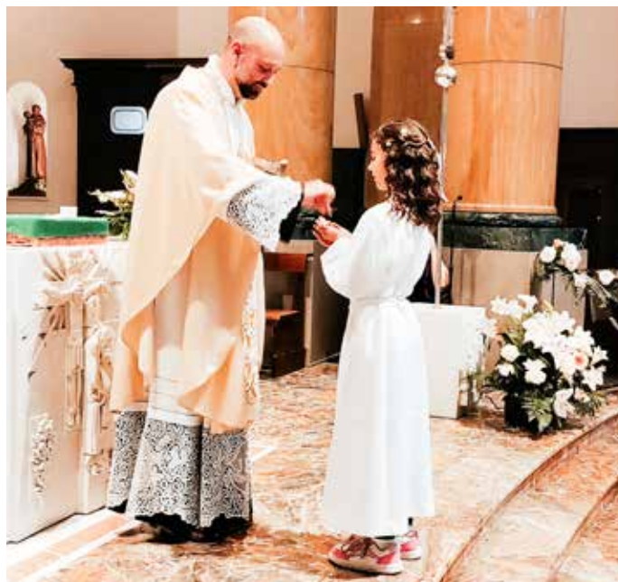
Prima Comunione in Basilica (foto di repertorio)

Negli anni le cose sono cambiate, il fare festa e condividere le vicende importanti della vita con i propri cari ha assunto dimensioni diverse. E festa c'è stata quando da mamma, con