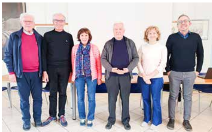
Alcuni componenti del direttivo di Casa della Carità

"La Casa della Carità - ha ripreso don Bruno - è l'espressione più autentica di una Chiesa che si educa e che cerca di educare alla carità secondo il Vangelo. Quel che è sorprendente è la crescita che è avvenuta in cinque anni, sia dei servizi offerti dalla struttura ma anche, in termini non soltanto numerici, dei volontari che vi operano. E l'averla dedicata giusto un anno fa, proprio all'indomani della sua scomparsa, a papa Francesco è stata una precisa volontà di rispondere al suo desiderio di una Chiesa al servizio dei poveri".