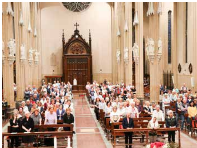
La tradizionale chiusura del mese di maggio a S. Valeria

Al santuario della Madonna dei Vignoli e nella chiesa di Maria Ausiliatrice presso il Piccolo Cottolengo di don Orione si prega poi il santo rosario da lunedì a venerdì alle 20,30; presso la chiesa del monastero delle suore Adoratrici (Sacramentine di via Stefano)