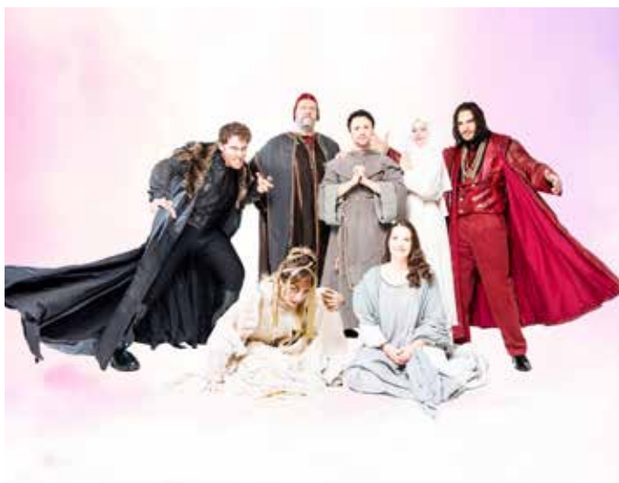
La locandina del musical "Forza venite gente"

Altro ritorno sarà quello del gruppo degli "Oblivion" con "Win for life". La loro prima volta al San Rocco risale al 27 febbraio 2014 con "Oblivion