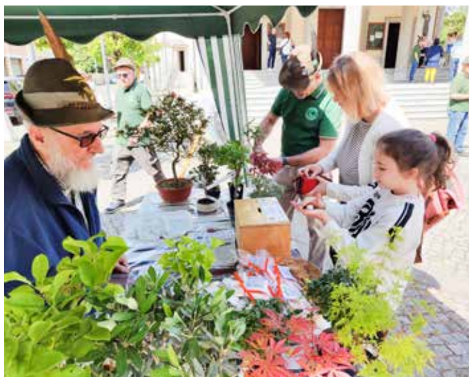
La collaborazione degli Alpini con il GSA

Gli Alpini, sul piazzale della chiesa della Beata Vergine Addolorata al Lazzaretto, hanno consolidato con la loro presenza la lunga condivisione di intenti con il GSA, mentre a S. Ambrogio erano presenti gli atleti del Gruppo Camosci, da sempre solidali con i progetti in Africa. Presenti i soci GSA sul piazzale della Basilica, davanti all’Abbazia, nel cortile delle Adoratrici perpetue, sul piazzale del santuario dei Vignoli e della chiesa di San Giovanni Bosco al Ceredo. Sabato 16 e domenica 17 maggio la manifestazione si concluderà