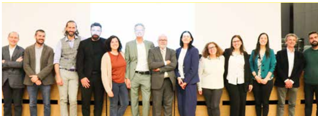
I dirigenti degli istituti paritari della Brianza presenti a "ScegliAMOci"

Gli studenti negli istituti tecnici sono 200 (5,7%) in quel-