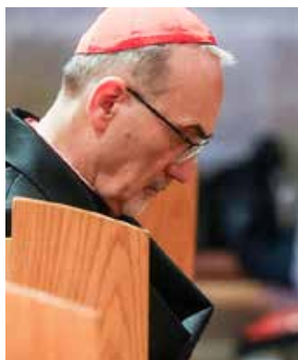
Il patriarca cardinale Pierbattista Pizzaballa

La Lettera è divisa in tre parti. La prima parte è una “valutazione dell'attuale stato di disordine”, per poi “ancorarsi saldamente alla realtà così com'è, ricono-