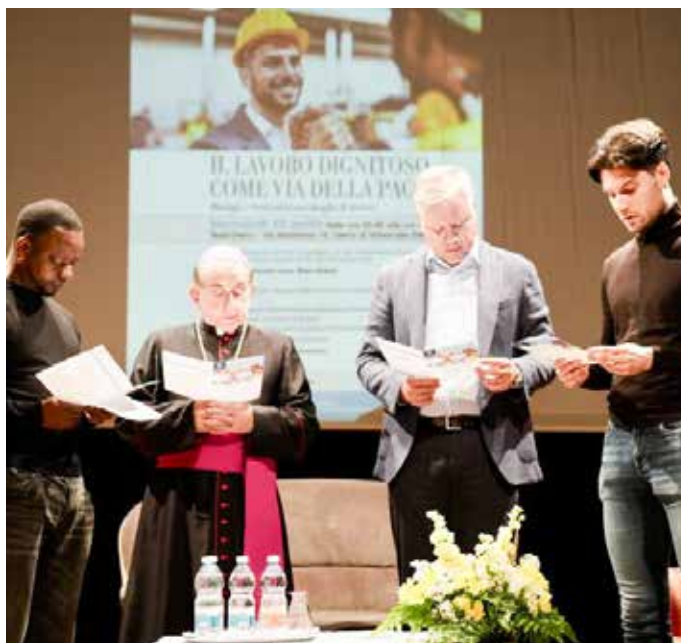
Delpini alla veglia per il lavoro a Oreno di Vimercate

Al contrario, sono chiamati a “convertire” il lavoro, rifiutando logiche che producono armi o sfruttamento, e scegliendo percorsi orientati al bene comune.