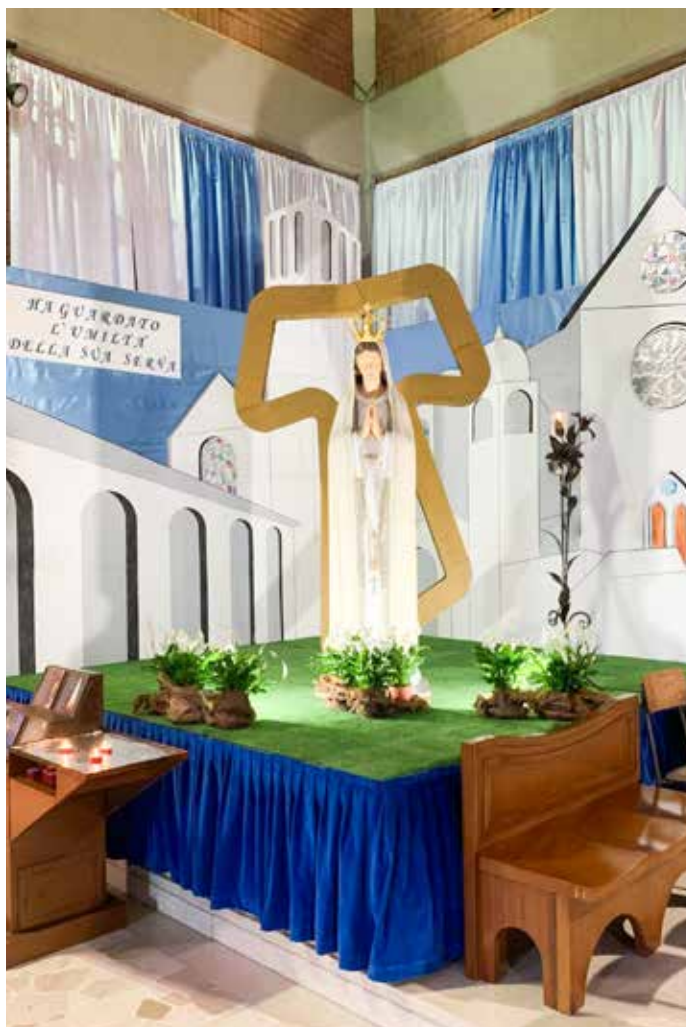
L'allestimento per la festa della Madonna di Fatima

La festa della Madonna di Fatima ha confermato ancora una volta il senso di appartenenza di condivisione dell'intera comunità parrocchiale alle proprie tradizioni.