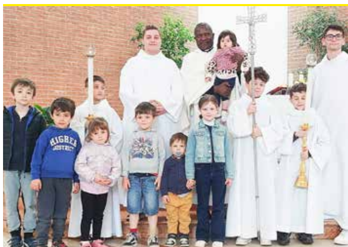
Il sacerdote keniano dopo la celebrazione della messa