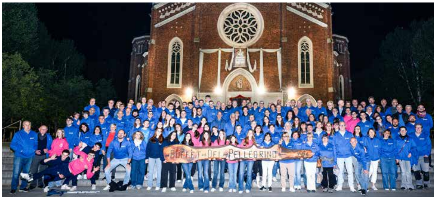
Gli oltre 200 volontari impegnati nelle molteplici iniziative che hanno animato la sagra di quest'anno

La carica dei 201 volontari, che con le braccia, la testa e il cuore sono stati gli 'artisti' della sagra