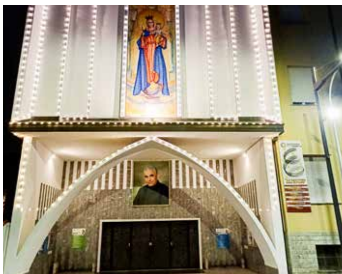
Il santuario di Maria Ausiliatrice al Don Orione