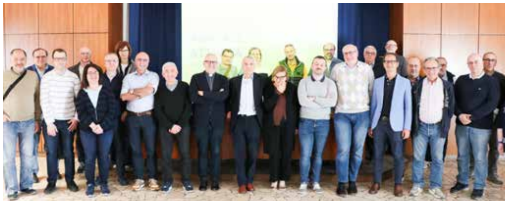
I partecipanti all'assemblea dell'Accec diocesana a Concorezzo