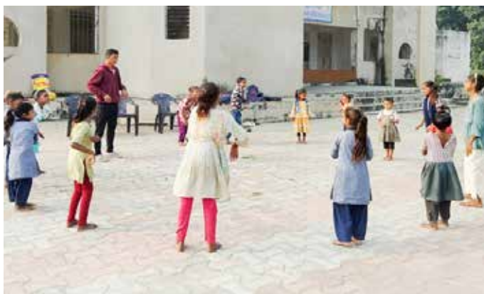
Un momento di attività sportiva nella missione