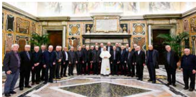
I sacerdoti ambrosiani ordinati nel 1976 con papa Leone XIV